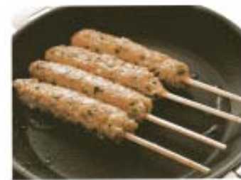
サラダ油で焼きつけ、表面に美しい焼き色をつける。