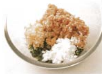
つくねの材料はこれ、手でよく混ぜ合わせる。

④ フライパンにサラダ油を熱し、③をつけるを両面で焼きつける。焼き色がつけ、ふたをしたら火を弱め、ふたをして中まで火を通す。