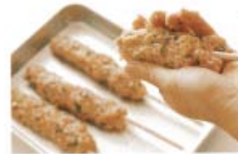
割り箸にくっつける。割り箸がなければ小判形に作ってもよい。