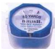
デンタルフロス 420円

鉛筆を持つように持ちます。歯間に入れ、歯肉溝の中まで入れて、上下に4～5回こすりましょう。フロス後はしっかり、うがいをして下さい。