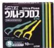
ウルトラフロス 10ヶ入 510円

ホルダー付で使いやすく耐久性がある為、歯ブラシと同じように水洗いで繰り返し使えます。引っかかると取りにくいですが、ハサミ等で糸を切ると取れます。