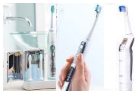
フィリップス パナソニック オムロン 「ソニックアーク」 「ドルツ」 「メディクリーン」

高速運動電動歯ブラシに、音波振動（音波20～20,000Hz）を加えたものです。ブラシの振動でプラークを落とすと共に音波の振動によって発生する、きめ細かい水の動きによってもプラークを落とします。ブラシ自体が動いているので手磨きと違い、自分でブラシを動かす必要はありません。お口の中の水分が多いほど音波の効果を発揮しやすいので、歯ブラシの毛をよく湿らせて使用するのが望ましいといわれています。