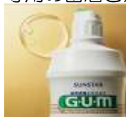
液体タイプの 歯みがき剤

電動歯ブラシを使用する際は、液体・ジェルタイプ・低研磨剤の歯磨き剤の使用をお勧めします。研磨剤の多いものは、歯磨き剤の粒子が機械細部まで進入し、故障の原因のひとつになります。「電動歯ブラシ専用の歯磨き剤」もあります。