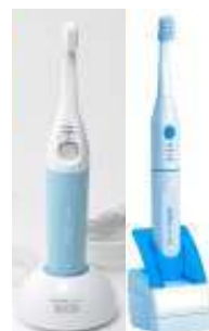
(左) ヤーマン (右) 東レ 「8020」 「ウルティマ」 *製造中止 在庫のみ販売中